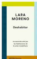
Deshabitar Lara Moreno DESTINO 11.90€