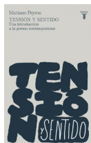
Tensión y sentido Mariano Peyrou TAURUS 17.90€