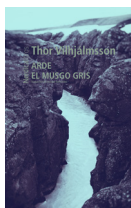
Arde el musgo gris Thor Vilhjálmsón NÓRDICA 21.50€