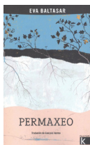
Permaxeo Eva Baltasar FAKTORÍA K DE LIBROS 17.00€