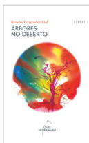
Árbores no deserto Rosalía Fernández Rial GALAXIA 15.00€