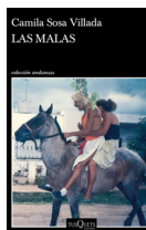
Las malas Camila Sosa Villada TUSQUETS 18.00€