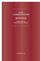
Estigia Else Lasker-Schüler TRES MOLINS 17.00€