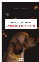
A vinganza dos homes bos Manuel Esteban XERAIS 17.70€