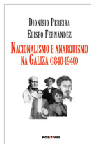
Nacionalismo e anarquismo na Galiza Dionisio Pereira / Eliseo Fernández POSITIVAS 15.00€